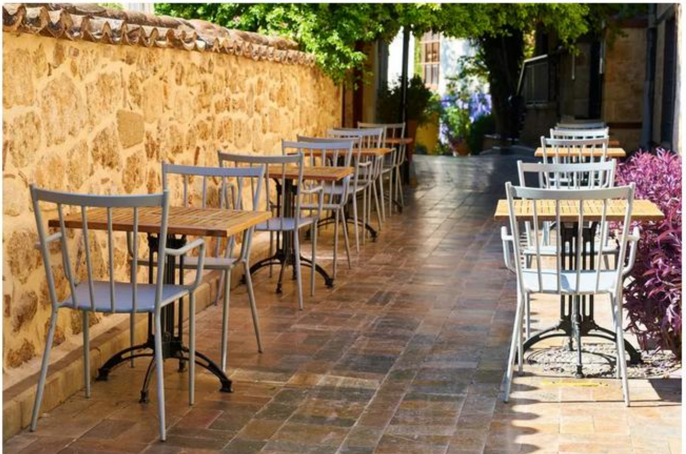
Terrasse d'un restaurant. ● © engin_Akyurt/pixabay